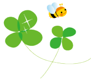
ほんわかの家八幡 ★:子どもセンター階版

NPO法人ほんわかハート事務局 TEL/FAX:0748-32-3077 E-mail:honwaka2@gmail.com